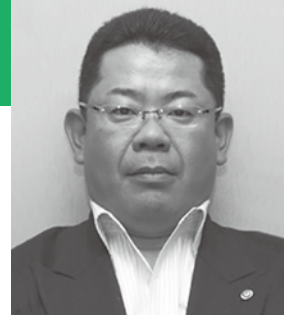
きょうの のぶひろ

〒001-0022 札幌市北区北22条西5丁目2-18 ケイシンII TEL/011-756-8211 FAX/011-758-6378